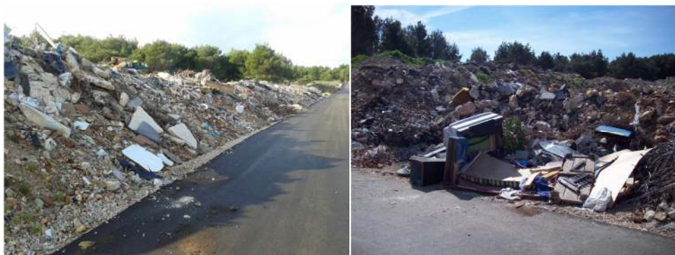
Slika 3: divlje odlagalište Lozice

Gauss–Krüger koordinate odlagališta: Y: 5504045 ; X: 4908000