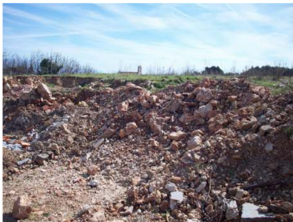
Slika 4: divlje odlagalište Pravulje

Gauss–Krüger koordinate odlagališta: Y: 5505909 ; X: 4906247